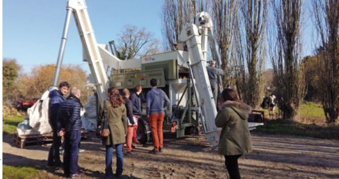
Trieur mobile Marot de la CUMA des Ajoncs.

subvention de 40 % a été permise grâce à l'investissement en CUMA. Le débit de chantier est d'environ 4 tonnes/heure. En matière d'organisation, le trieur est uniquement utilisé pour trier des mélanges céréaliers ou de la semence de ferme. L'outil n'est pas dimensionné pour nettoyer post-récolte, il faut que chacun puisse disposer d'une capacité de stockage. Aujourd'hui, 32 paysans l'utilisent sur 6 plateformes différentes. Le planning d'utilisation est préparé avant la saison. Une part fixe de 100 € est demandée à chacun, ainsi qu'un coût d'utilisation de 45 €/heure d'utilisation. Ce coût intègre l'utilisation du trieur et le temps de présence de l'agriculteur chez qui se trouve la plateforme.