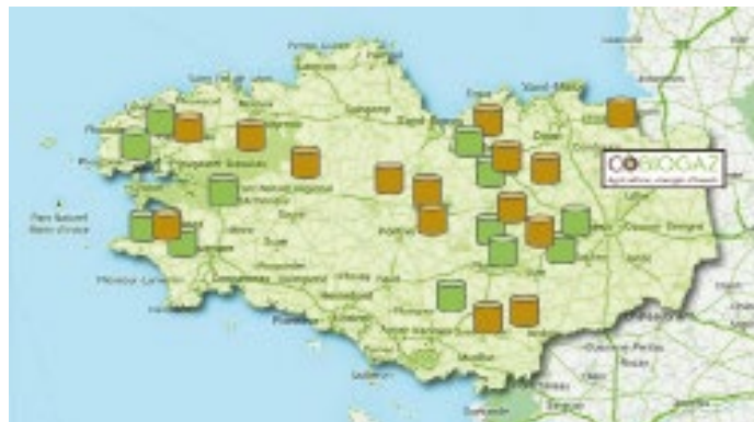
Localisation des méthaniseurs en Bretagne.