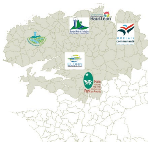
Carte du territoire du concours général agricole.