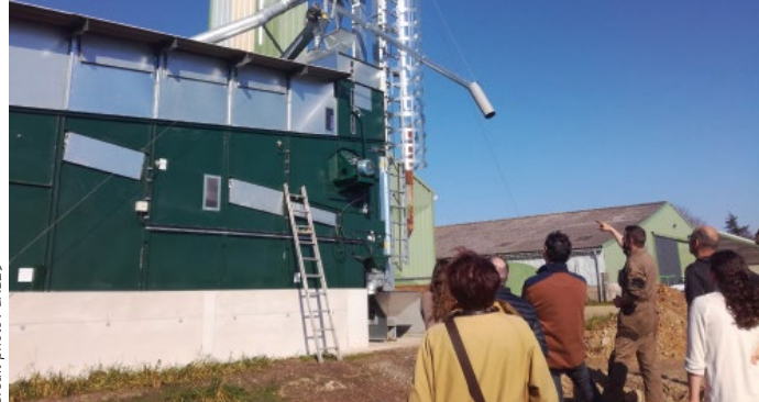
Séchoir fixe de la CUMA Argoat Bio.

La CUMA Argoat Bio , installée à Duault dans le sud-ouest des Côtes d'Armor, a de son côté investi dans un outil de séchage des grains. 4 paysans voisins (éleveurs et céréaliers) se sont associés fin 2017 pour investir dans un séchoir fixe. L'investissement total est de 120 000 €,