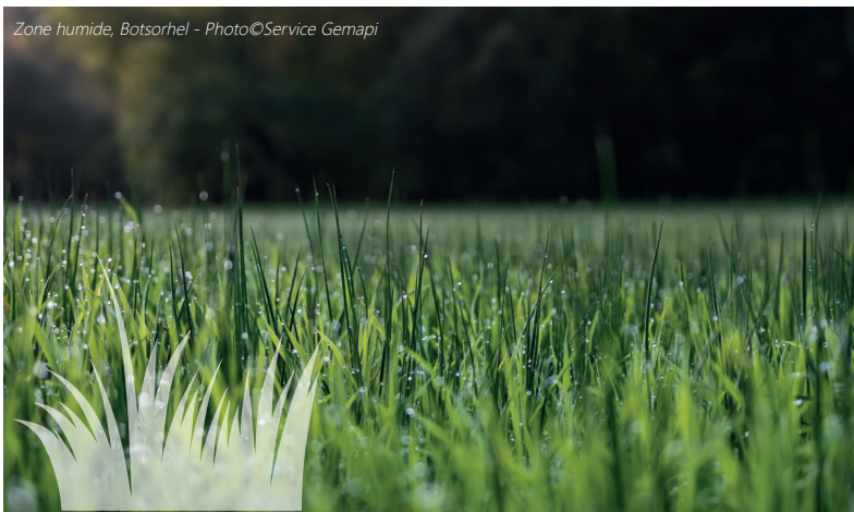
Zone humide, Botsorhel - Photo©Service Gemapi