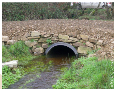
Arche de franchissement