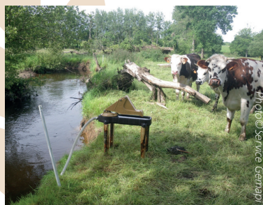
Pompes de prairie