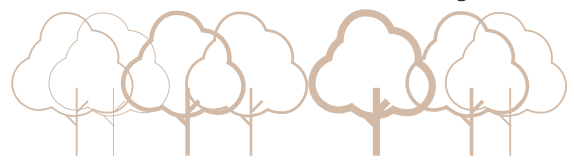
Gestion du bocage