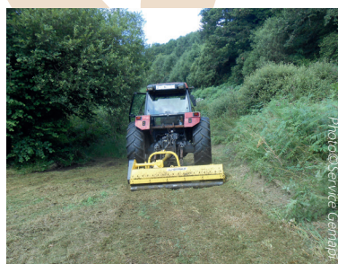
Broyage de végétation en zone humide